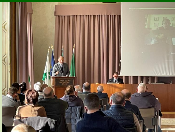
foto assemblea generale di Confagricoltura Varese del 21 nov. 2021

A tutti gli Associati di Confagricoltura Varese presso la Loro sede