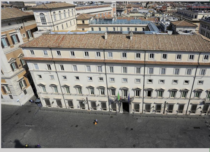
Roma Palazzo Chigi

Le maggiori disponibilità per i bandi filiera e logistica e per i processi di innovazione, le nuove risorse su Industria 5.0 e nuova Sabatini, lo sviluppo delle energie rinnovabili e in particolare l'introduzione dello sviluppo del biofuel da fonti agricole sono risposte concrete alle richieste avanzate da Confagricoltura nell'assemblea generale del 12 e 13 luglio scorsi.