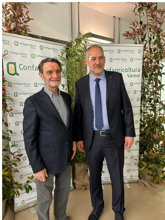
Il presidente Attilio Fontana con Giacomo Brusa

Li vediamo sempre alle nostre assemblee. Con loro colloquiamo con continuità e a loro forniamo importanti spunti legislativi per la difesa dell'agricoltura provinciale, regionale e spesso anche nazionale. Si siamo grandi nel fare, nel proporre, nel fare agricoltura in un territorio molto difficile. Anche per questo sia il ministro Giorgetti che il presidente Fontana hanno in più occasioni definito eroi gli agricoltori varesini.