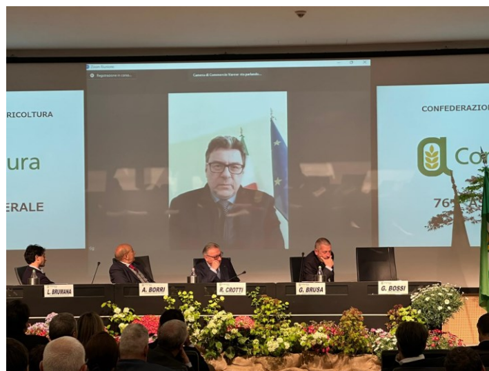
Il ministro Giorgetti all'assemblea del 28 aprile in video conferenza