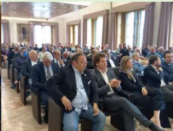
Alcune Immagini dell'assemblea di Confagricoltura Varese del 29 maggio 2022