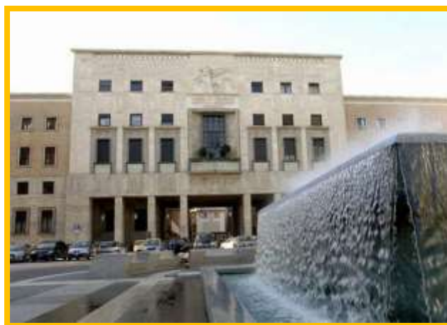
"Camera di commercio di Varese

Firenze, 24 marzo 2023 - Siccità, crisi internazionale e lievitazione dei prezzi energetici: il contesto in cui operano oggi le imprese agricole è emergenziale. Si è parlato anche di questo alla Conferenza Nazionale delle Camere di Commercio "Progettare il domani con Coraggio" , in corso Firenze, dove Massimiliano Giansanti , presidente di Confagricoltura, è così intervenuto: La tecnologia può fornire un valido aiuto, ma serve supporto dalle istituzioni per abbattere i costi di gestione e consentire alle imprese una rapida transizione green. Emerge la necessità di impostare una visione comune che