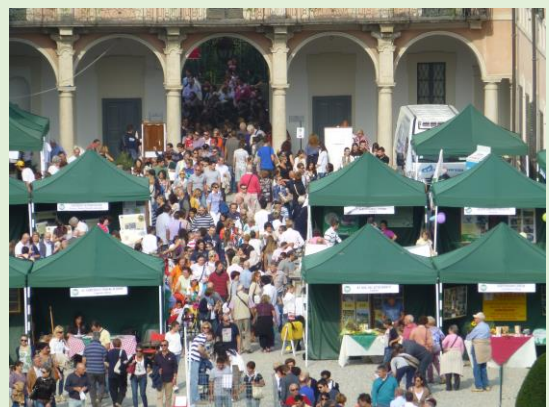
(Un Agrivarese di qualche anno fa)

La domanda di partecipazione potrà essere presentata fino a esaurimento (vedi indicazioni a pag. 5) degli spazi espositivi disponibili, secondo le modalità annualmente indicate nell'apposito bando