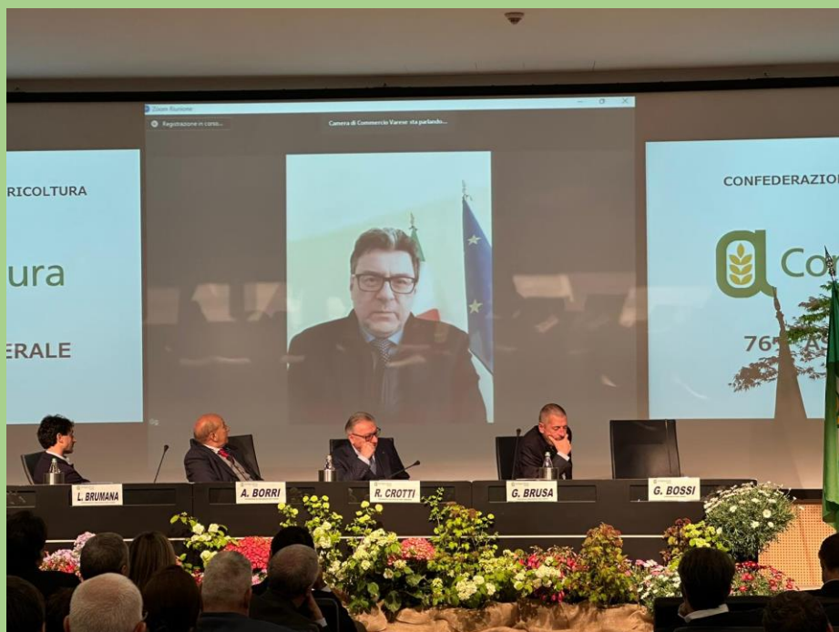
Foto archivio Tavolo della presidenza assemblea del 23 aprile 2023