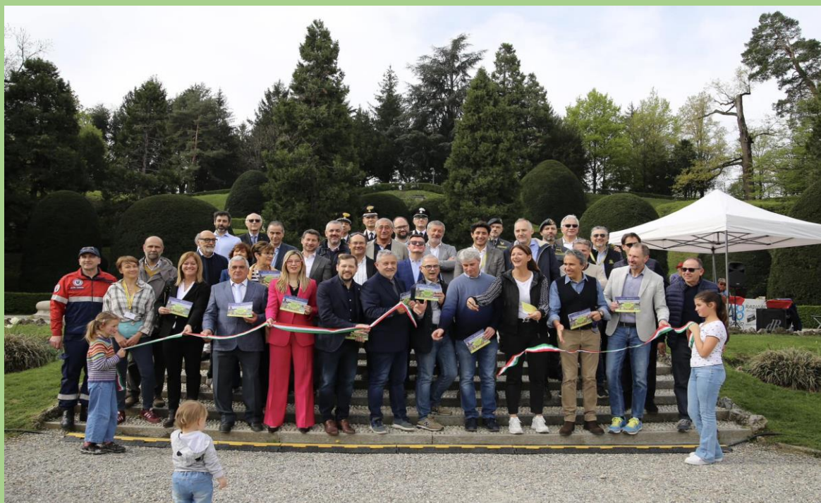
inaugurazione AgriVarese in città